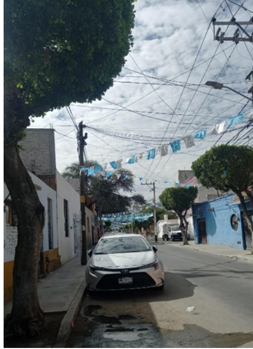
Figura 2. Decoraciones en colores alusivos a la Virgen de la Purísima Concepción en Avenida Hércules Oriente.