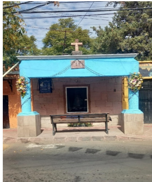
Figura 3. Recinto con Imagen de la Virgen de la Purísima Concepción.