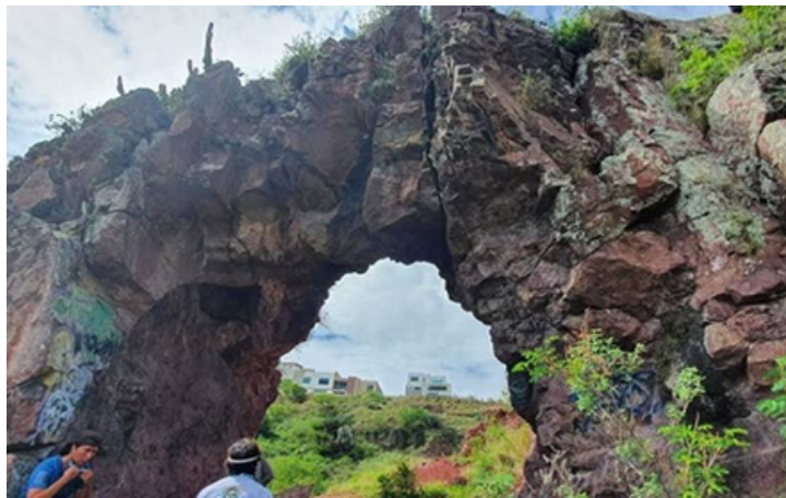
Figura 4. Peña Agujerada.

Según la investigación realizada por Jaramillo (2016) las laderas que rodean Hércules, también conocidas como El Cerro Colorado, se consideran parte del territorio de la comunidad, por su significado cultural y religioso, pues en sitios del Cerro, se llevan a cabo eventos religiosos como la veneración a la Santa Cruz y la misa en honor a la Virgen de la Purísima Concepción el día 8 de diciembre, donde en la punta más alta del Cerro, se encuentra colocada una figura de la Virgen. Así mismo el Cerro Colorado alberga el sitio Prehispánico “Peña Agujerada” que según (Ramos M. , 2020) en un artículo del periódico Noticias de Querétaro, la Peña Agujerada es una maravilla natural que fue llamada por Conín, el “Gran Juego de Pelota”